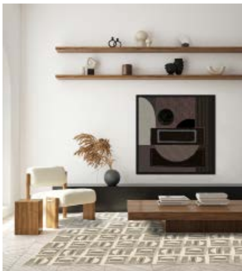
Sundown Wallvelvet en Clickclack Carpet ontworpen voor Mondilab.